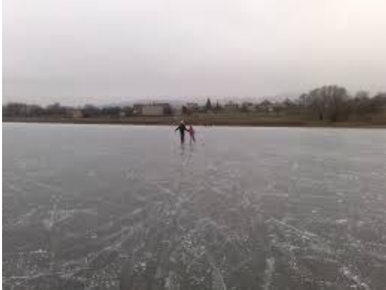
Ružín v zime

Obec Košická Belá leží v nadmorskej výške 380 metrov v severovýchodnej časti Volovských vrchov v tzv. Hámorskej brázde v doline potoka Belá, ktorý ako pravostranný prítok Hornádu zásobuje Ružínsku priehradu. Chatisko (200 m od Penziónu Sivec) je situované v lone krásnej prírody v rekreačnej oblasti Ružínska priehrada medzi lyžiarskymi strediskami Jahodná a Plejsy cca 25 km od Košíc. V prípade priaznivých poveternostných podmienok (mínusové teploty) je možné korčuľovanie na Ružínskej priehrade. Chata prešla rekonštrukciou v rokoch 2013 – 2014 a je v prevádzke od 11/2014. Chatisko je zaradené do kategórie hotel Garni / B&B. Do jaskyne sa dostaneme presunom autami a pešo cca 1,5 - 2 hod.. Doporučujeme vziať si oblečenie, ktoré sa môže značne zašpiniť. Nezabudnite na baterky – na svietenie v jaskyni.