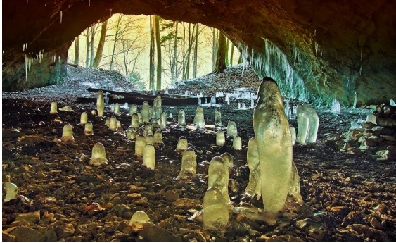
Velká ružínska jaskyňa

Miesto konania: Chatisko , (predtým Hotel chata ISKO), Košické Hámre 144, 044 65 Košická Belá