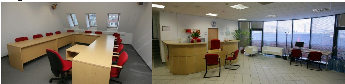
priestory hracieho miesta